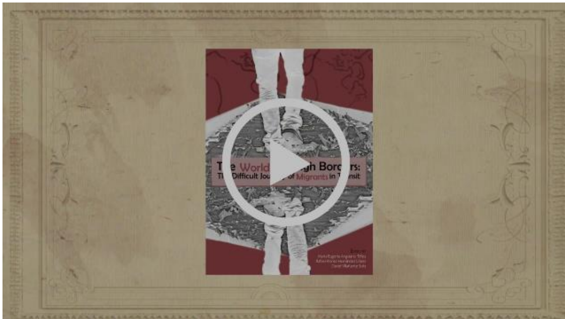
#FLT2019 | Presentación del libro: The World Through Borders: The Difficult Journey of Migrants in Transit.