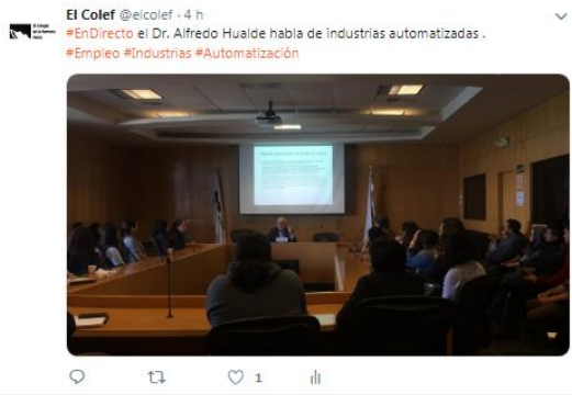
Instagram: Alumnos de la #UPN visitan #ElColef