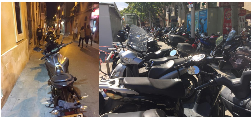
Figura 3. Motos vs. espacio público en Barcelona

Especialmente grave es este último aspecto, en el que se subordina el espacio público destinado al peatón a la voracidad de aparcamiento de las motos , las cuales no sólo no pagan por hacerlo en la vía pública (como es el caso de los automóviles, en las zonas reservadas para ello), sino que privatiza un espacio por naturaleza de todos, como son las áreas peatonales.