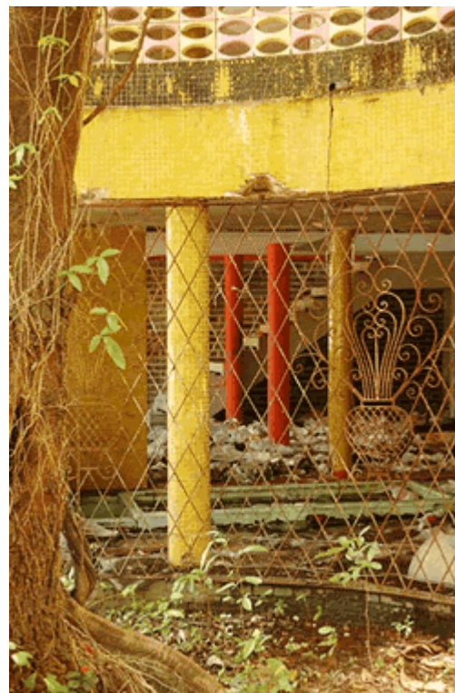
Vista externa da casa à Rua Padre Anchieta, 530. Veja artigo de Elisa Vaz Ribeiro em Minha Cidade

Noticiário geral Veja todas as notícias disponibilizadas em Vitruvius