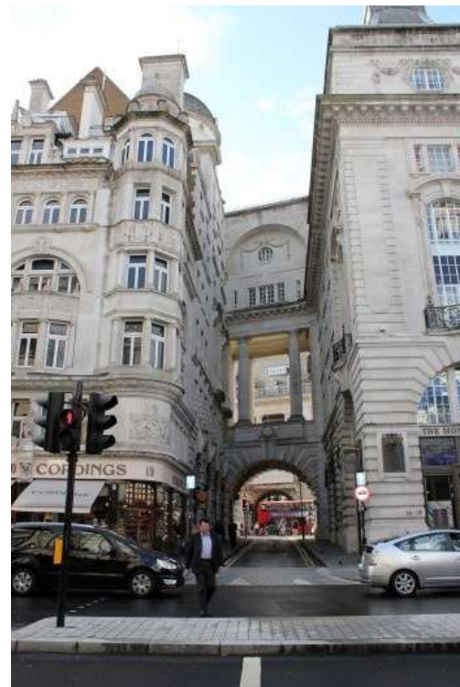
Picadilly Street, Londres. Leia o artigo de Vanessa Goulart Dornelles em Arqueturismo

Noticiário geral Veja todas as notícias disponibilizadas em Vitruvius