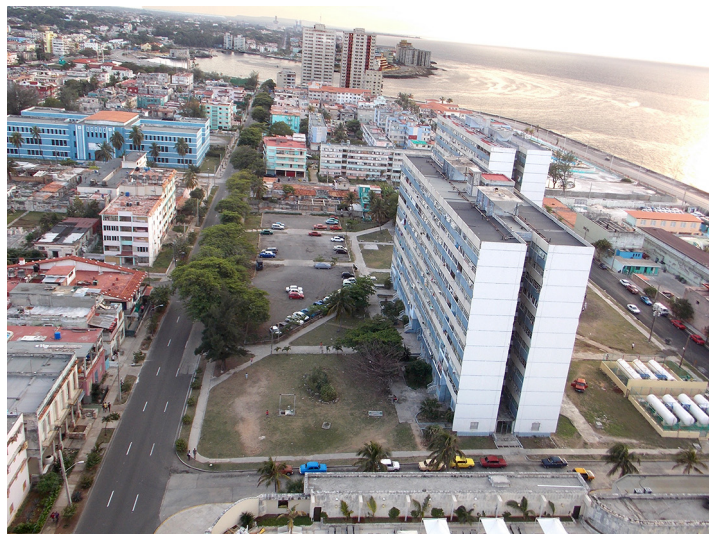
[Imagen 4] La Habana.