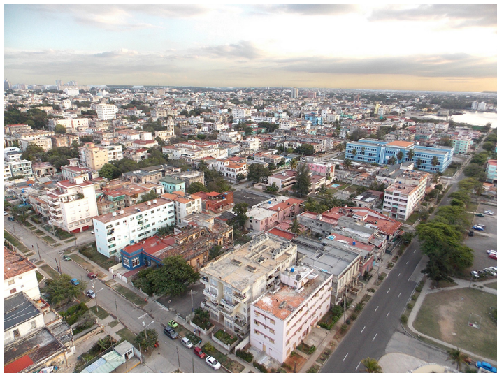
[Imagen 3] La Habana.