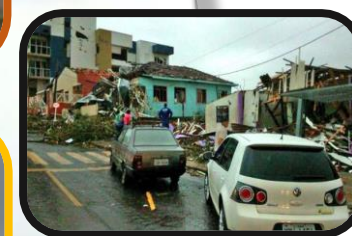
Xanxerê, Santa Catarina, Brasil, 2015.

UNIVERSIDAD DE LA HABANA LA HABANA, CUBA.