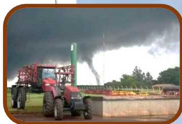
Santa Rita, Paraguay, 2014.