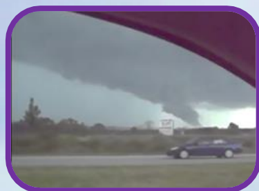
Delaware, EE.UU, 2009.