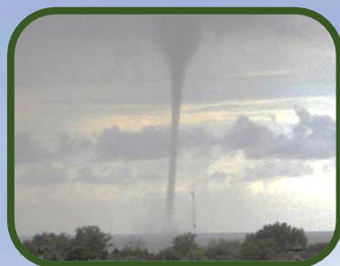
Provincia Argentina de Misiones, Argentina, 2017