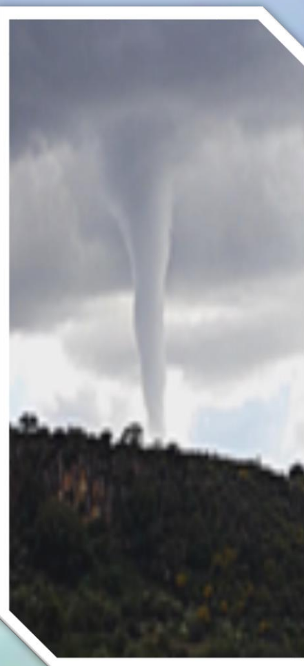
Yahualica, Jalisco, México, 2015