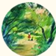
Arboles de Vida Bolivia