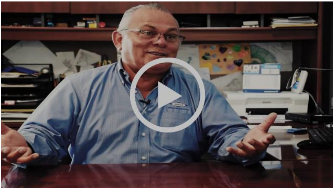
El Colef Matamoros a 36 años de distancia