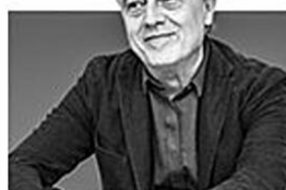
Stefano Boeri STEFANO BOERI ARCHITETTI