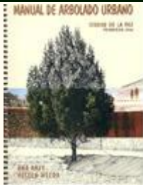
Manual de Arbolado Urbano – Ciudad de La Paz