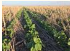
Ensayos, Investigación y Tecnologías aplicadas a la SOJA