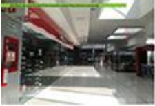
Adaptación del diseño arquitectónico de tiendas comerciales por contingencia sanitaria de la COVID-19