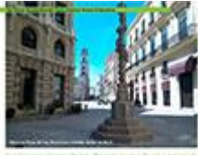
Las Intersecciones de las Dimensiones Cultural y Espacial de la Ciudad en la Planificación Urbana

Miguel Antonio Padrón Lotti RESUMEN: El estudio de las intersecciones de las dimensiones cultural y espacial de la ciudad en la planificación urbana es un tema que ha sido abordado por numerosos autores. Este artículo busca analizar las intersecciones de las dimensiones cultural y espacial de la ciudad en la planificación urbana, con el fin de comprender mejor su importancia y su impacto en el desarrollo urbano. ABSTRACT: The study of the intersections of the cultural and spatial dimensions of the city in urban planning is a topic that has been addressed by numerous authors. This article seeks to analyze the intersections of the cultural and spatial dimensions of the city in urban planning, in order to better understand their importance and their impact on urban development.