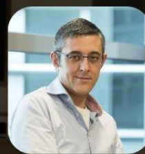
Eduardo Madina Muñoz