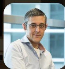
Eduardo Madina Muñoz