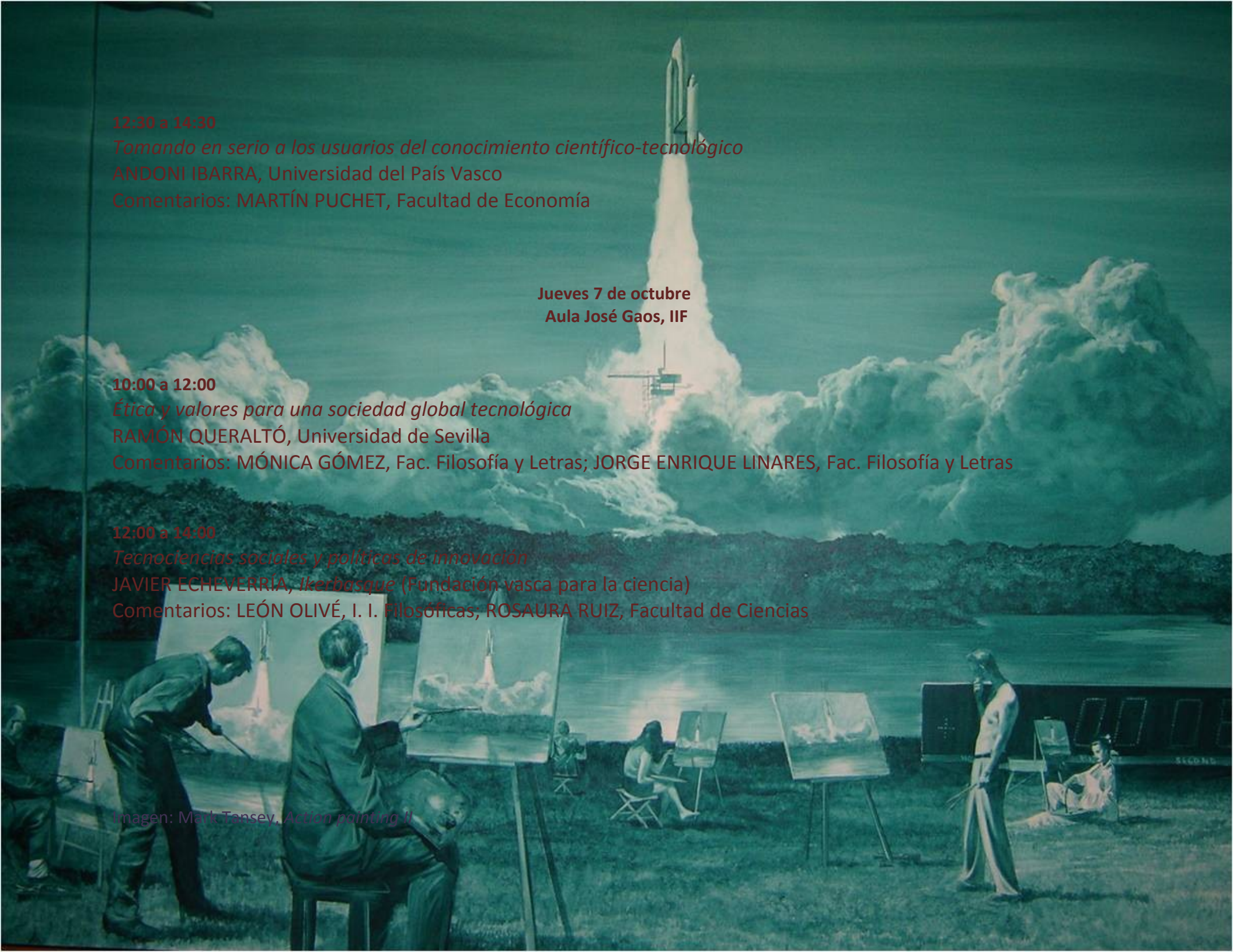
Imagen: Mark Tansey, Action painting II