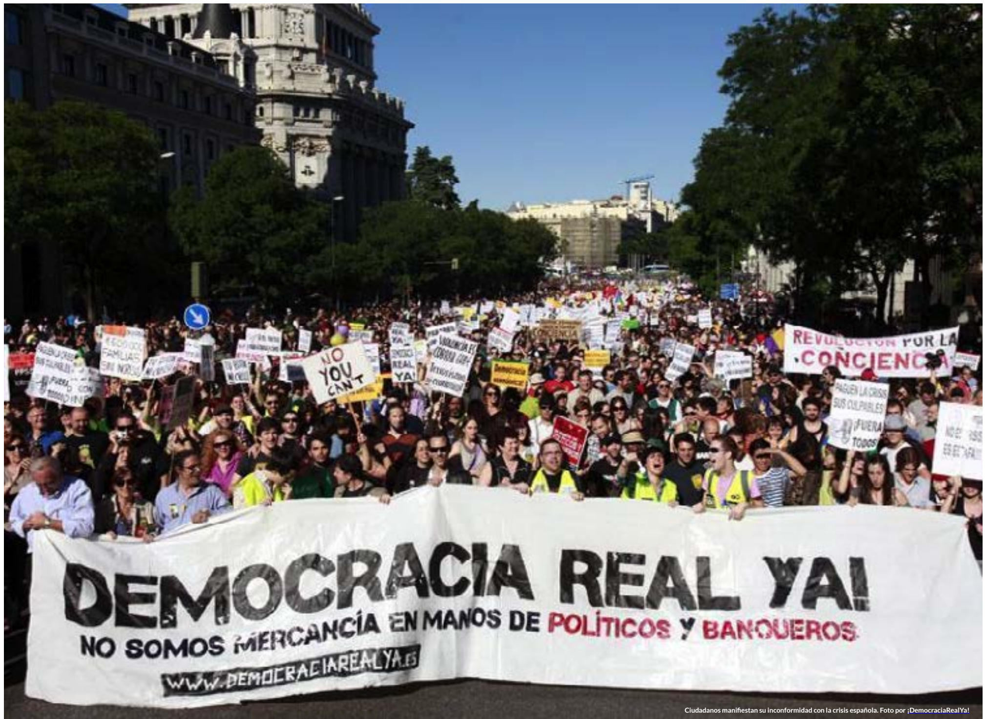
Ciudadanos manifiestan su inconformidad con la crisis española.