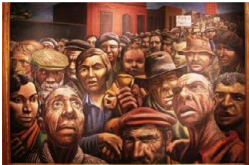
Antonio Berni, Manifestación (1934)

La participación ciudadana no es sólo una forma de hacer política sin muchas pretensiones, sino también es una manera de impulsar el desarrollo local integrando a la comunidad. Su mecanismo es el involucramiento de la población en las decisiones de los gobiernos sin necesidad de formar parte de la administración pública o de un partido político.