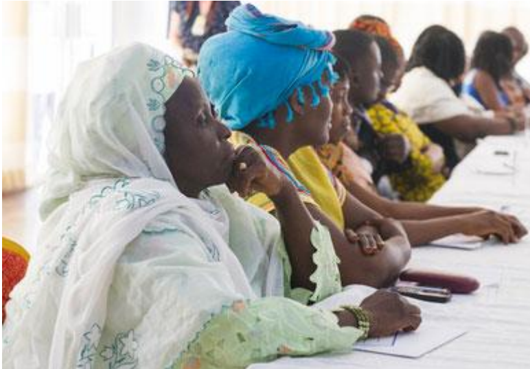
Representantes de la Sociedad Civil, Sierra Leona.

La democracia es un valor universal basado en la voluntad libremente expresada por los pueblos de determinar sus propios sistemas políticos, económicos, sociales y culturales y su plena participación en todos los aspectos de sus vidas.