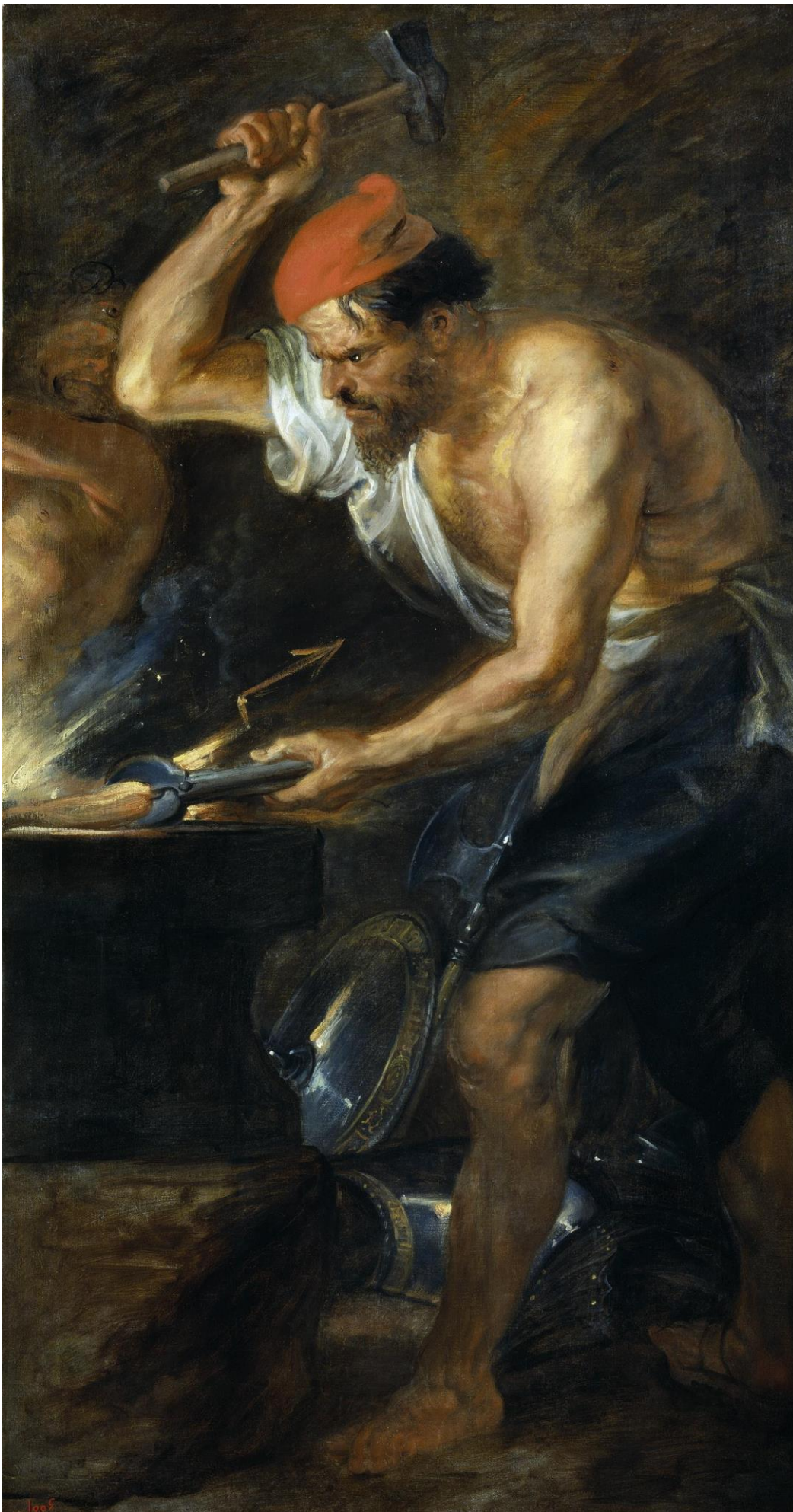
Pedro Pablo Rubens: " Vulcano forjando los rayos de Júpiter ", óleo sobre tela, Museo del Prado.