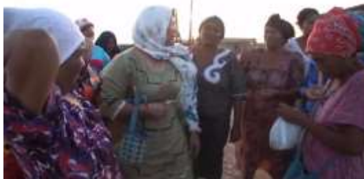
Women and the Colombia Peace Accord