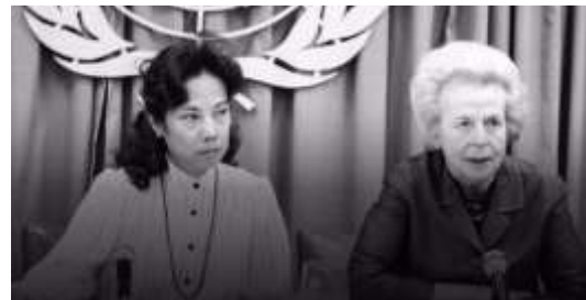
Reunión para conmemorar el Decenio de la Mujer el 4 de abril de 1978