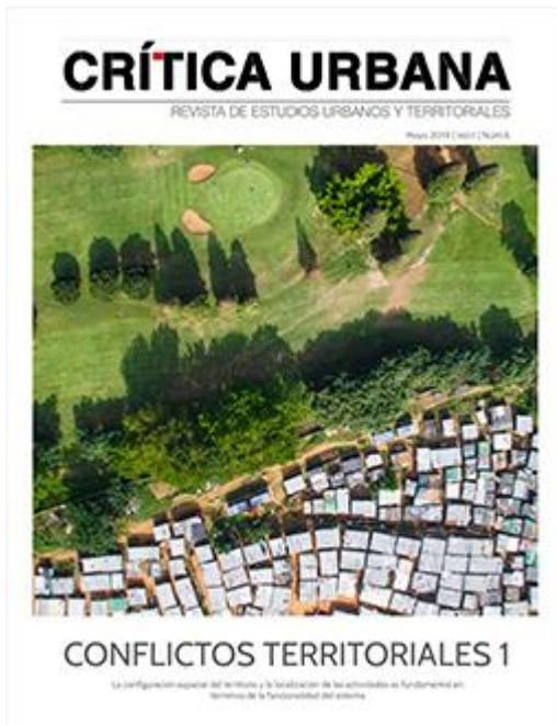
Crítica Urbana N.6