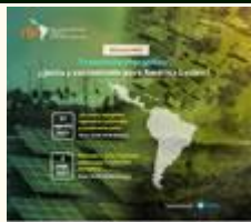
Webinar: Transición energética: ¿justa y sustentable para América Latina?