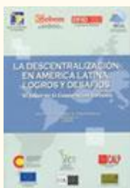
La Descentralización en América Latina, logros y desafíos: el papel de la cooperación europea