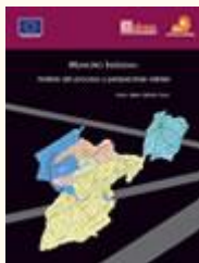
MUNICIPIO INDÍGENA: Análisis del Proceso y Perspectivas Viables