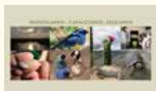
El Museo Nacional de Historia Natural (MNHN)