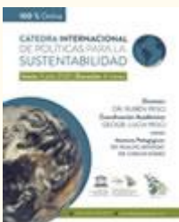
Cátedra Internacional de Políticas para la Sustentabilidad

El Máster en Gestión Sostenible del Ambiente , tiene una duración de cuatro trimestres. Las asignaturas del plan de estudios del Máster, especifican su carga de trabajo en términos de créditos ECTS . La carga total del máster es de 60 créditos ECTS (1.500-1.800 horas de trabajo) , de los cuales 50 ECTS corresponden a una secuencia básica de tres trimestres donde se imparten nueve cursos diseñados para dar una sólida formación en las áreas centrales del programa. Posteriormente se realiza un cuarto trimestre (10 ECTS), para la realización del Proyecto de Fin de Máster - PFM .