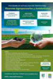
Finanzas Agropecuarias y Ambientales