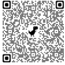
Sitios importantes RII 2022, Toluca